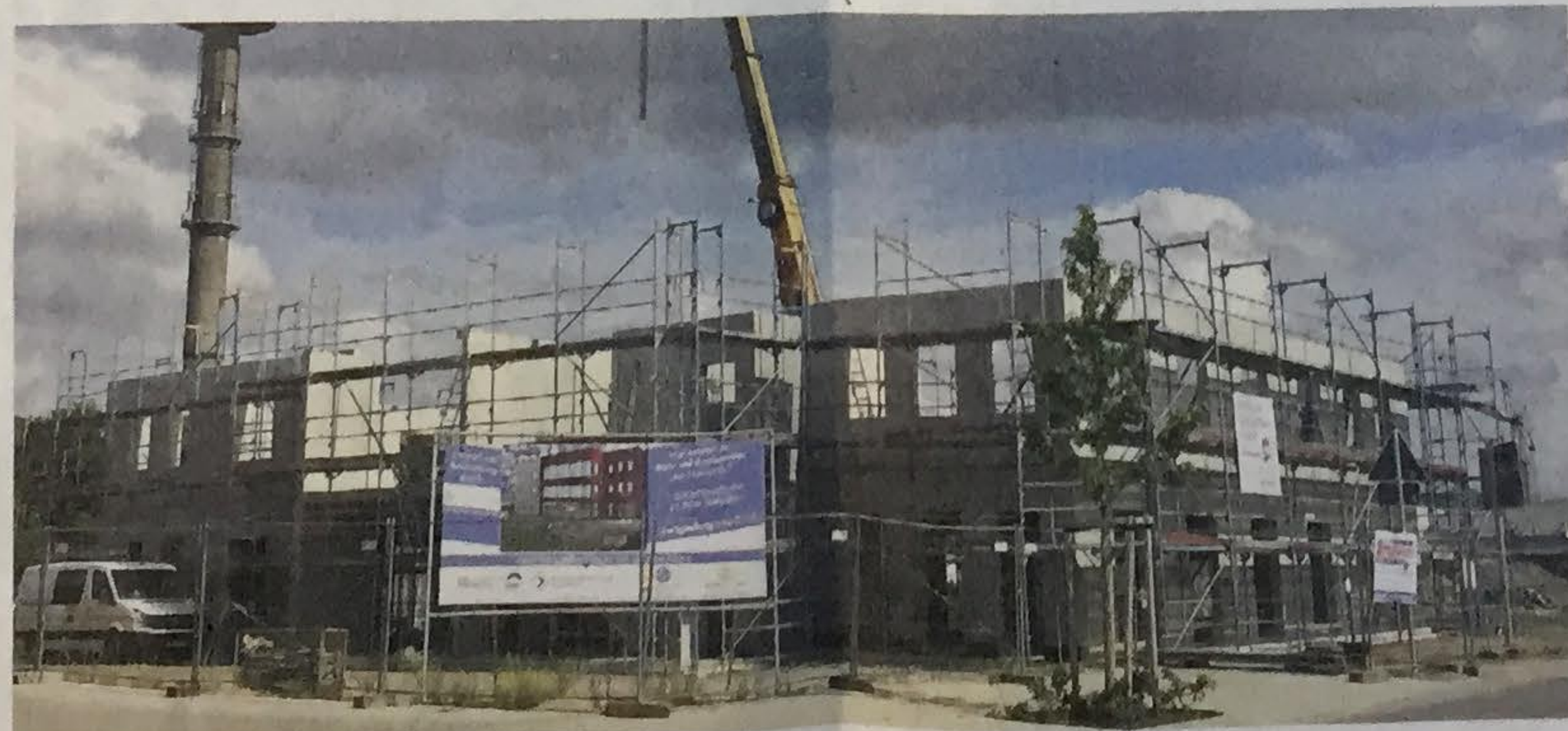
Voll im Zeitplan liegen die Bauarbeiten für das neue Büro- und Praxisgebäude. Ende dieses Jahres sollen die Räumlichkeiten bezugsfertig sein.